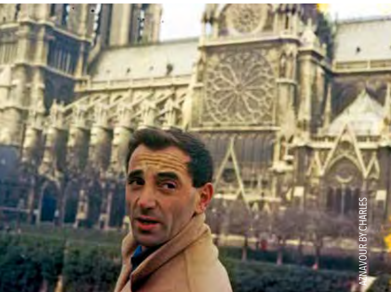
AZNAVOUR BY CHARLES