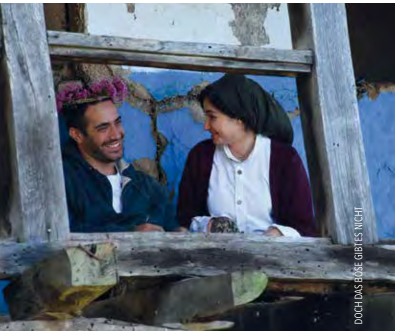
DOCH DAS BÖSE GIBT ES NICHT

Unter dem Dach der Filmstadt München e.V. finden ganzjährig Festivals und Filmreihen statt. Die FILMKUNSTWOCHEN zeigen Kostproben ihres Programms.