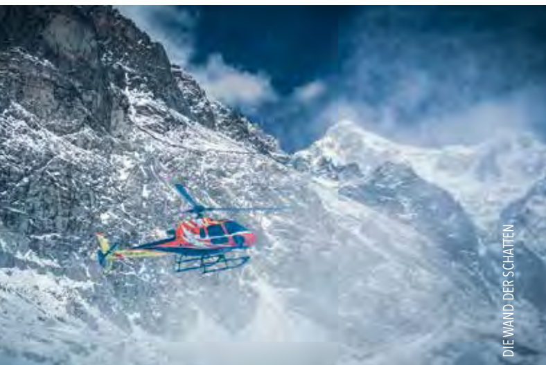
DIE WAND DER SCHATTEN