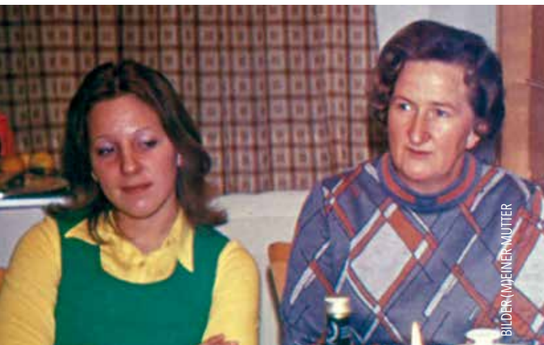
BILDER (M)EINER MUTTER