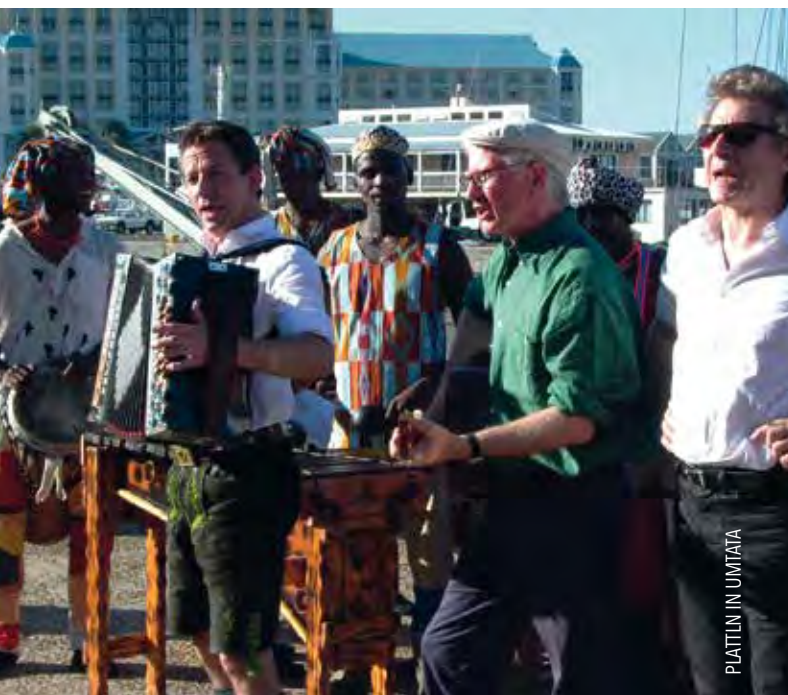
PLATTLN IN UMTATA

Anfang des Jahres wurde die Aktion „Anstehen für die Kinos“ ins Leben gerufen, die sich während der Kino-Schließungen als 12-teilige Mini-Serie durch die Stadt zog. Viele Filmschaffende haben sich beteiligt und sind jetzt zu den Filmkunstwochen eingeladen. Ein Credo für das Kino!