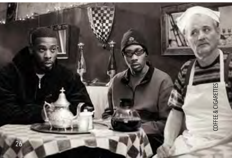
COFFEE & CIGARETTES