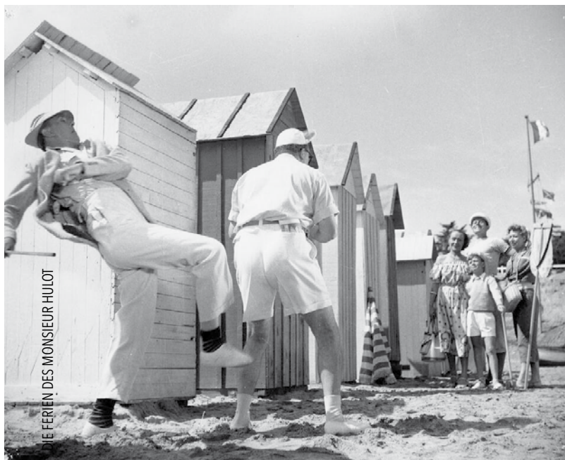
DIE FERIE DES MONSIEUR HULOT