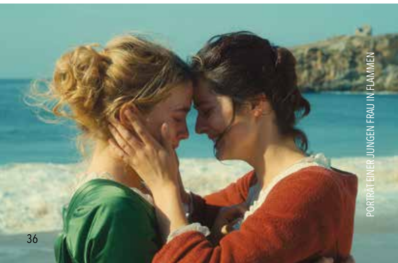
PORTRÄT EINER JUNGEN FRAU IN FLAMMEN