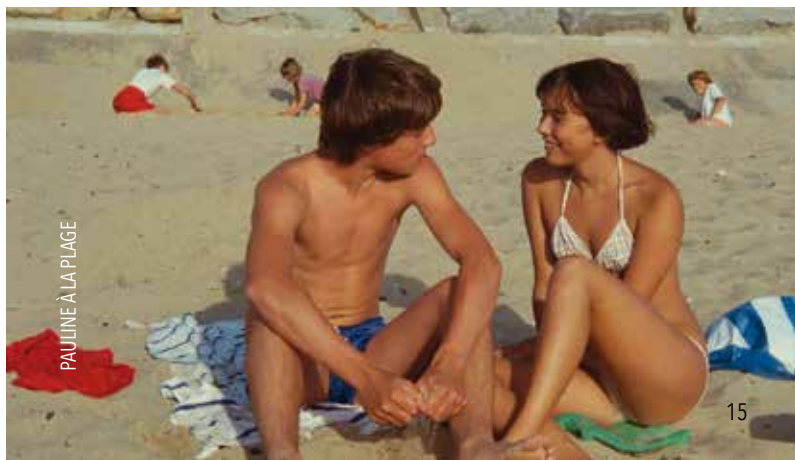
PAULINE À LA PLAGE

BRD/FR/IT 1966 | 89 Min | R: Michel Deville | Mit Anna Karina, Mario Adorf Während der Sohn eines Flottenadmirals von Agenten verfolgt wird, spielt die Schwester seine Rolle an Bord eines Kriegsschiffes. Parodistische Komödie voller Kalauer und Slapstickzitate. 35mm Do 20.8. 18:00 Theatiner